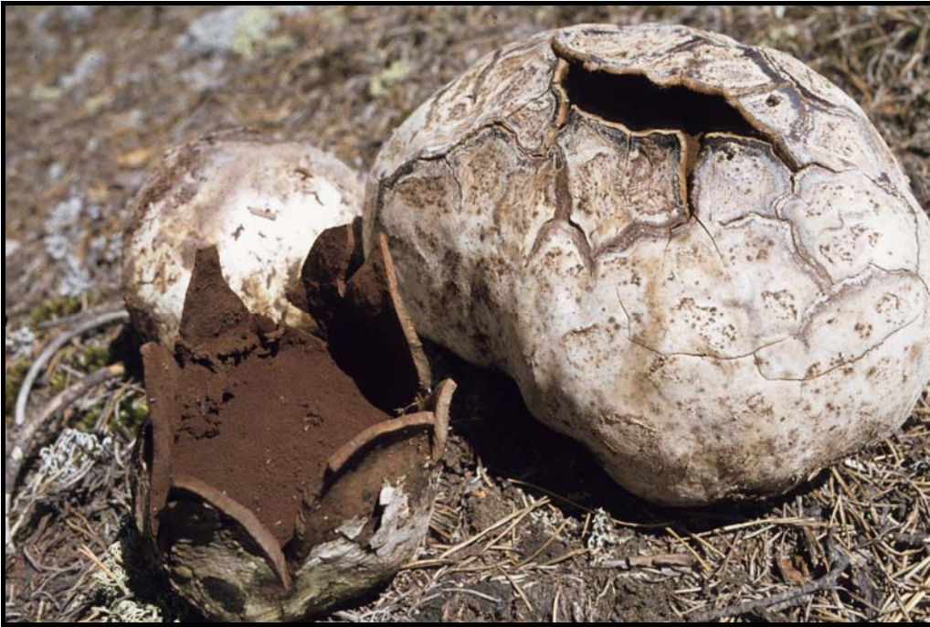
Läderboll Mycenastrum corium vid Glanshammar (Karebos berg) i Glanshammars socken.

Nidularia deformis (Willd.: Pers.) Fr. & Nordholm, gytttrad nästsvamp. Glanshammar Alhambrastugan 846/812 barrskogshygge, vedrester 4.X.1990 conf.. MJ. Hult 838/793 barrskog, vedupplag 31.VIII.1992 LC $ conf. MJ. Karsjön 843/780 barrskog, gammalt timmerupplag 6.IX.1994 conf. MJ. Lerbäck Långsjön 304/614 barrskog, timmerupplag 2.IX.1990 conf. MJ. Kyrksjön 373/582 barrskog, sandigt timmerupplag 13.VIII.1985. Ödeby Käggleholm 875/783 sumpskog, på döda stammar grävde 27.IX.1994 conf. MJ.