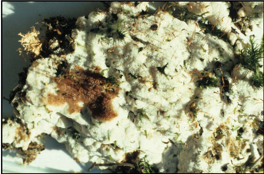
Sårticka Physisporinus sanguinolentus vid Klockarhyttan i Lerbäckes socken.