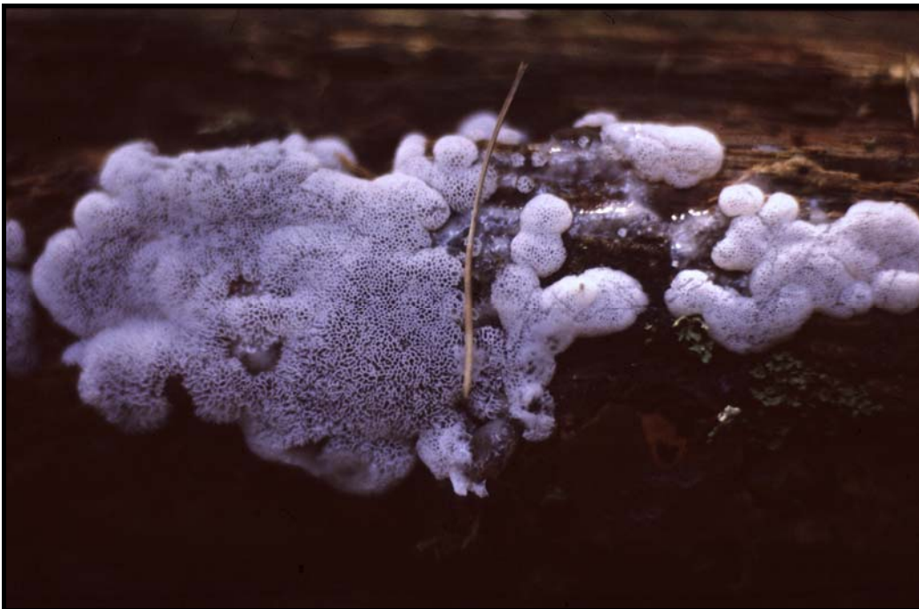
Slemhorn Ceratiomyxa fruticulosa var. poroides vid Kyrksjön i Lerbäcks socken.

Tubifera ferruginosa (Batsch) Gmelin, bikakssvamp. Askersund Djupviken 290/508 blandskog, starkt murken granlåga 6.VIII.1990 det. UE (GB). Solberga 294/492, blandskog, på murken lövved 14.IX.1979 ES $ conf. SR.