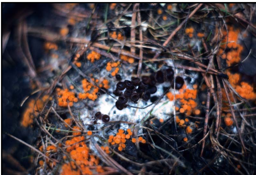
Orange älglegeskal Byssonectria terrestris och mörk älglegeskal Nannfeldtiella guldeniae vid Finnafallsmossen i Viby socken.

Byssonectria terrestris (Alb. & Schwein.: Fr.) Pfister, orange legeskål. Bo Kårtorpa floar 342/784 ungtallskog, på älgspilling 20.IV.1979 conf. SR. Glanshammar Skumparberget 843/757 barrskog, älgspilling 17.IV.1982 conf. SR. Hammar Bernströmstorpet 293/559 barrskog, älgspilling 1.V.1980 conf. SR. Lerbäck Hylletorp 398/557 tallskog, älgspilling 2.V.1980 conf. SR. Åsbrohammar 407/563 barrskog, älgspilling 13.V.1979 conf. SR. Ödeskärr 392/548 limstensbrott, älgspilling 3.V.1980 conf. SR. Ödeskärr 389/550 barrskog, älgspilling 3.V.1980 conf. SR. Ramundeboda Gillersmossen 436/273 ungtallskog, älgspilling 19.IV.1979 YS $ conf. SR. Trollåsmossen 414/272 ungtallskog, älgspilling 19.IV.1979 YS $ conf. SR. Rinkaby Kilbergsmossen 811/717 barrskog, älgspilling 17.IV.1982 conf. SR. Viby Finnafallsmossen 404/390 ungtallskog, älgspilling 21.IV.1979 conf. SR.