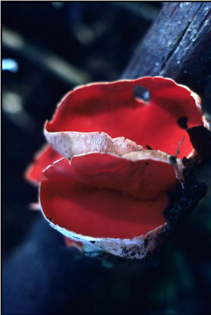
Scharlakansvårskål Sarcoscypha coccinea s. lat. vid Äsplunda i Rinkaby socken.

Lämnar avslutningsvis en lista över publikationer och inventeringsrapporter där jag har varit delaktig. Dessa skrifter kan för den intresserade ge ytterligare information om svampfloran i olika delar av Närke.