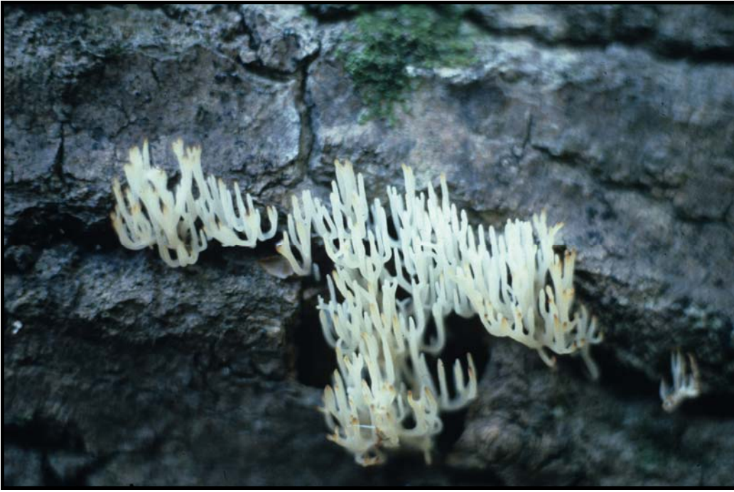
Vit vedfingersvamp Lentaria subcaulescens vid Viken i Lerbäckes socken.