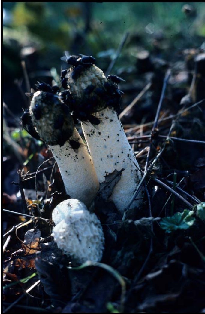
Stinksvamp Phallus impudicus vid Nalaviberg i Viby socken.

Sphaerobolus stellatus Tode: Pers., slungboll. Glanshammar Skävesund 746/784 hagmark, på starkt murken aspgrenlåga 4.X.1994 conf. ÅL. Tulostoma niveum Kers, vit stjälskröksvamp. "EN" Glanshammar Skölv 777/777 åkerkant, i mosstuva på kalkstensblock 20.V.1993 $ & LC, foto ÅL (Nilsson 1999). Tidigare sedd av NH på lokalen. Vascellum pratense (Pers.: Pers.) Kreisel, ängsröksvamp. Glanshammar Skävesund 749/778 gravfält 23.X.1982. Lerbäck Åsbro 416/569 park, i gräsmatta 18.IX.1997. Rinkaby Ramstena 808/723 kant skogsväg 9.IX.1962. Snavlunda Tjälvesta 381/473 ängsmark 3.X.1971 och 19.VII.1998.